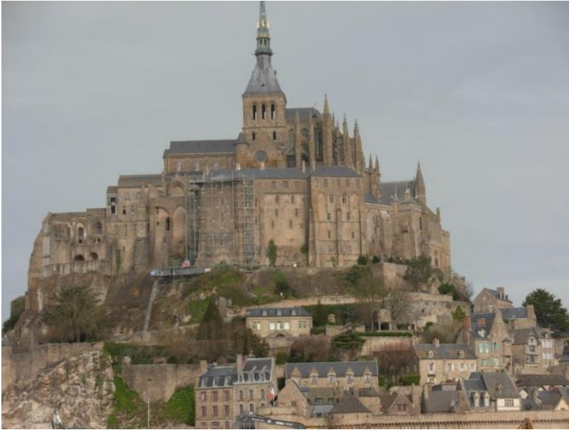
Il famoso Mont Saint

Michel ha fatto da sfondo alla nostra prima gita: quest'isolotto sul mare è la sedimentazione di varie epoche e stili che sono sempre più riusciti ad avvicinarsi al cielo.